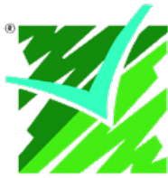
Republic of Lebanon Ministry of Environment Government of Lebanon

طور شركاء محفز العمل المناخي لمؤتمر الأطراف السادس والعشرين هذه الدعوة إلى العمل، وأيدتها البلدان والمنظمات الواردة أدناه خلال الفترة القصيرة المتاحة أثناء انعقاد مؤتمر القمة في جلاسجو. وفي الأسابيع والأشهر التي أعقبت المؤتمر، سواصل جمع المصادقات من شركاء المحفز وغيرهم، وسنحدث الشعارات المبينة هنا. يُرجى الاطلاع على الصفحة الأخيرة حيث تُدرج قائمة كاملة بشركاء المحفز. إذا رغبت بلدك أو منطمتك في تأييد هذه الدعوة، يُرجى إرسال بريد إلكتروني إلى cop26.catalyst@wiltonpark.org.uk