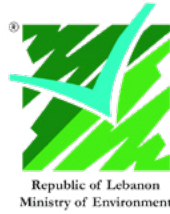
Government of Lebanon

وضع هذه التوصيات فريق العمل المعني بالشفافية والإبلاغ، من محفز العمل المناخي لمؤتمر الأطراف السادس والعشرين، ويشمل الفريق ممثلين من البلدان والمنظمات الواردة أدناه. تؤيد هذه المؤسسات التوصيات في وقت النشر الأولي لها، وندعو مزيد من المنظمات والبلدان إلى تأييد التوصيات أثناء مؤتمر الأطراف السادس والعشرين وبعده .