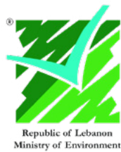
Government of Lebanon

Estas recomendaciones han sido elaboradas por el Grupo de Acción Catalizador de la COP26, Transparencia Y Presentación de Informes, que incluye a representantes de los países y organizaciones que enumeran más adelante. Estas instituciones respaldan las recomendaciones al momento de su publicación inicial; invitamos a otras organizaciones y países a respaldar las recomendaciones durante y después de la COP26.